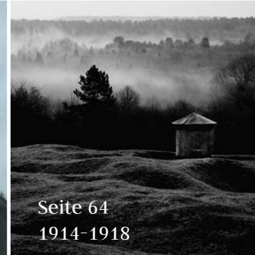
Seite 64 1914-1918