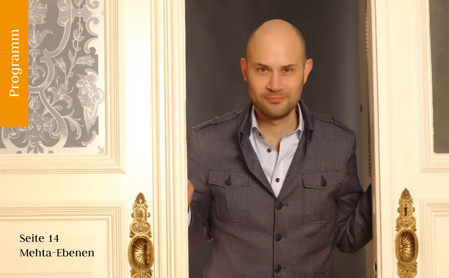
Seite 14 Mehta-Ebenen