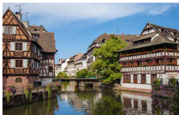
Elsass: Oper im Grenzbereich Opéra national du Rhin / Intendanten-Interviews