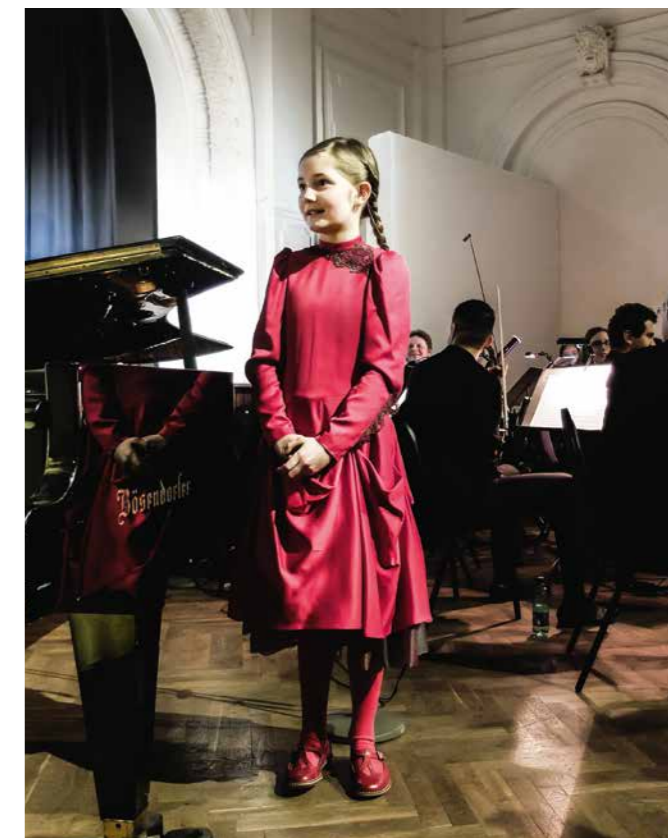
Alma Deutscher Eine starke Persönlichkeit