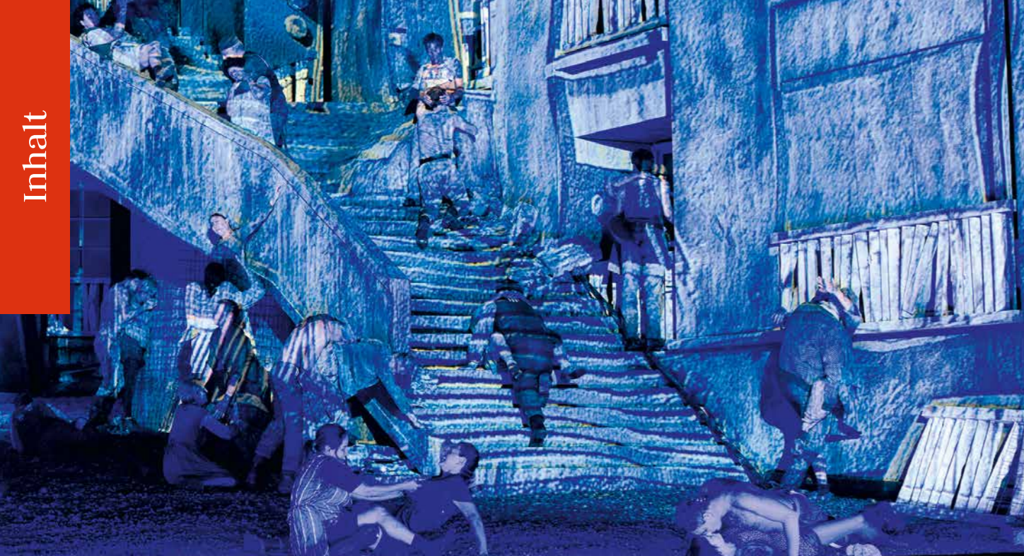
Traumbilder in Salzburg Für Sie gesehen / Ö-Ton: »Lady Macbeth von Mzensk«