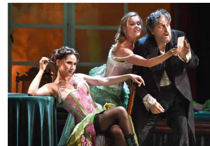
»Ring«-Auftakt in Düsseldorf Musikgenuss an der Deutschen Oper am Rhein