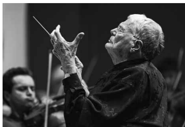
Sir Jeffrey Tate Eine Würdigung