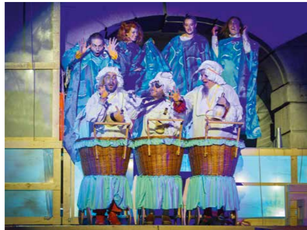
Ausgegrabene Ergötzlichkeit Seite 80 bei den Innsbrucker Festwochen d. A. Musik