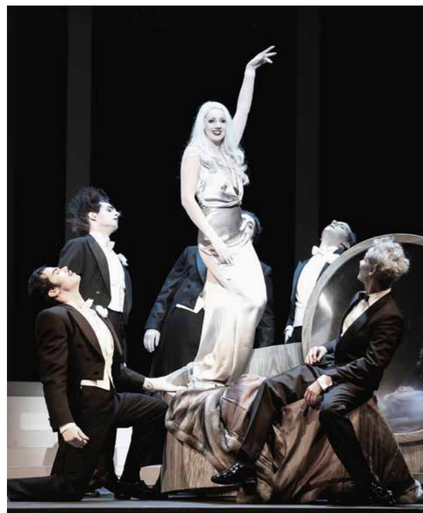
Die leichte Muse mit »Axel an der Himmelstür« Seite 24