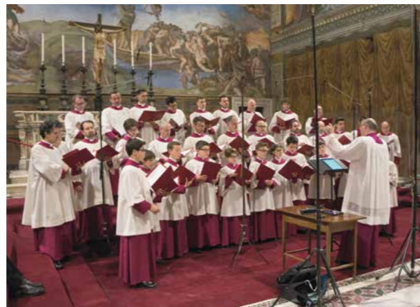
CD-Präsentation in Rom: Der Chor Seite 74 der Sixtinischen Kapelle singt »Palestrina«