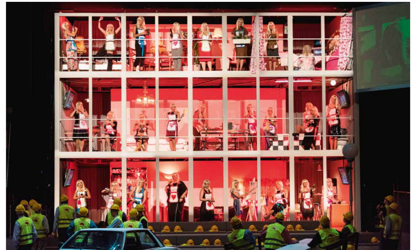
Wagners »Holländer« aus der Sicht vier unterschiedlicher Produktionen Seite 94