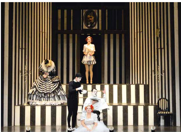
Aufführung in Venedig beendet die Vergessenheit einer Hervé-Operette Seite 78