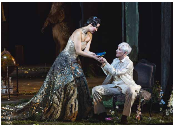
Mit Händels »Alcina« wurde in Genf die Opéra des Nations eröffnet Seite 6