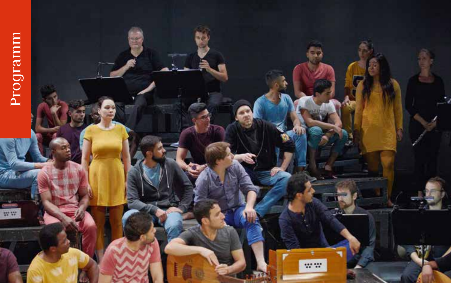
Vereint gegen die Fremden-Furcht: Ein mutiges Ensemble baut auf Mozarts Opern. Seite 90 Das bemerkenswerte Projekt »Zuflucht Kultur« findet immer mehr Freunde