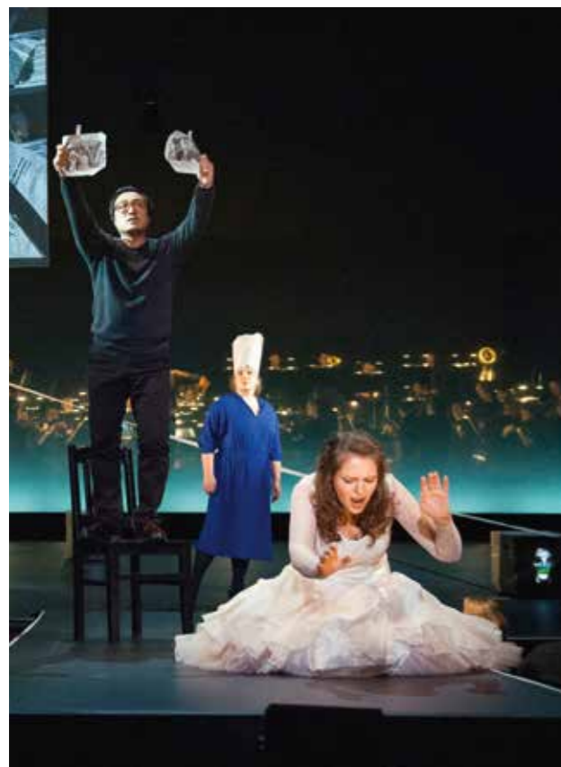
Von der Oper bis zum Musical: Seite 28 Neues von den Bühnen