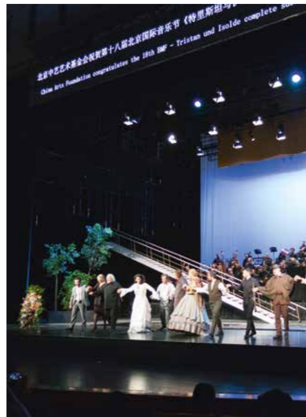
Tirol reist: Seite 22 Mit Richard Wagner nach China