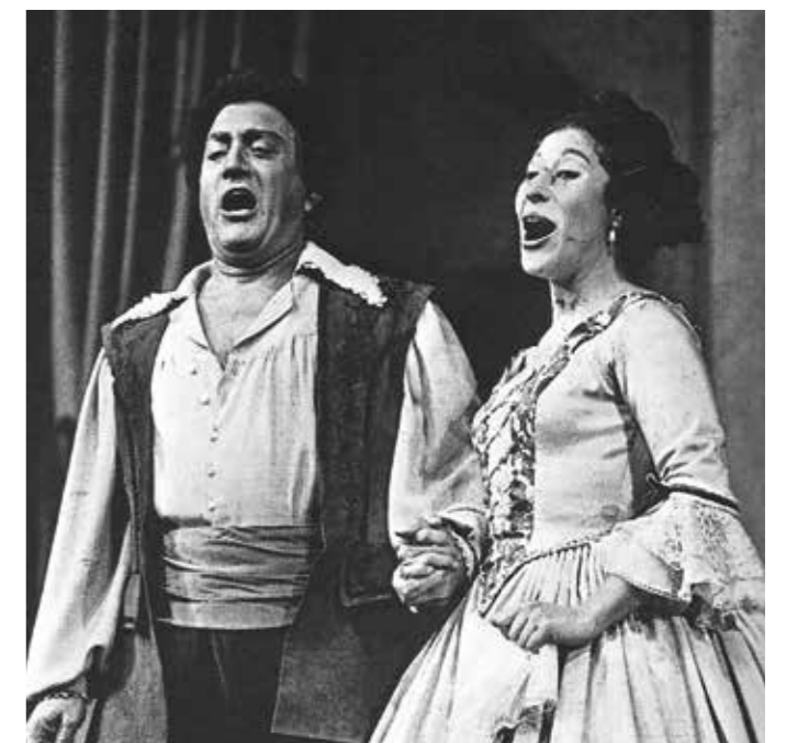
Rossinis Barbier: Seite 55 200 Jahre in Bildern